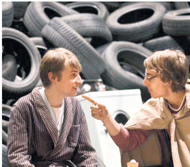
Die Liebe in Zeiten des Staatsbankrotts: Das Kollegitheater Sarnen probt Friedrich Dürrenmatts «Romulus der Grosse».

■ Samstag, 17. März, 19.30, Premiere Theater Altes Gymnasium, Sarnen, weitere Aufführungen bis 31. März, www.kollegitheatersarnen.ch